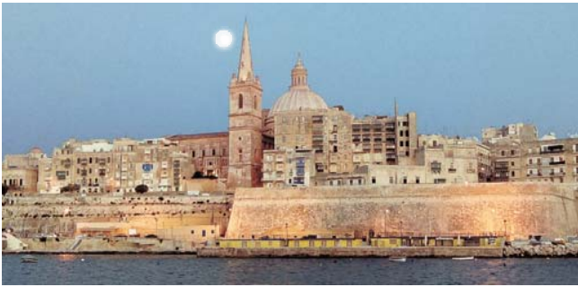
abendliche Silhouette von Valletta