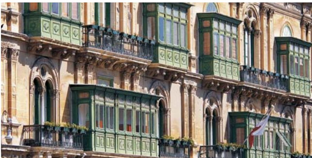
die für ganz Malta typischen Balkone sind ein Erbe aus arabischer Zeit

Nach der Anmeldung zu dieser Exkursion wird mit der zugesandten Buchungsbestätigung eine Anzahlung (15 % des Reisepreises) fällig. Die Restzahlung erfolgt zwei Wochen vor Reisebeginn. Es gelten die Geschäftsbedingungen des Veranstalters: Geopuls-Studienreisen, Neckarhalde 62, 72108 Rottenburg (Tel. 07472-9808802). Die Allgemeinen Reisebedingungen werden auf Wunsch vorab zugeschickt, oder können unter www.geopuls.de ausgedruckt werden.