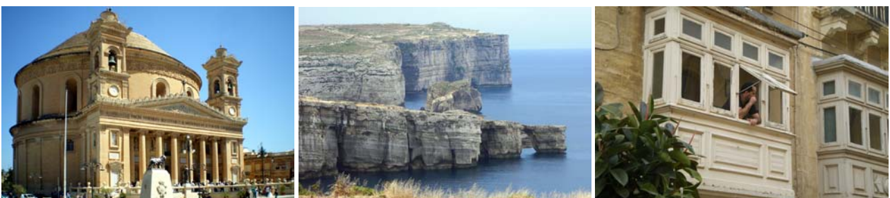
von links nach rechts: Rotunde von Mosta, steile Felsküste im Westen der Insel Gozo, die für ganz Malta typischen Balkone mit Verglasung

Johannisbrotbaum, antike Bienenhäuser (Apiaries), Wohnhöhlen und eine Römerstraße auf interessierte Besucher.