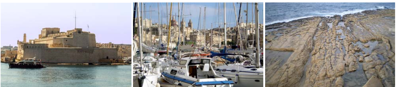
von links nach rechts: Fort Angelo und Grand Harbour Marina in Vittoriosa, Abrasionsplattform durch die Meeresbrandung bei Sliema

Vittoriosa , unter Maltesern gebräuchlicher als Birgu bezeichnet, liegt südlich gegenüber von Valletta. 1532 löste Birgu das ältere Mdina als Hauptstadt ab, bis 1571 dieser Status an Valletta überging. Die mächtige Festung Fort St. Angelo überragt die Stadt am Valletta zugewandten Ende und ist als eine der ältesten Festungen des Malteser-