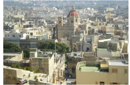
von links nach rechts: Azure Window vor seinem Einsturz 2017, Geflügelter Strandflieder ( Linonium sinuatum ), Victoria (Hauptstadt von Gozo)

Naxxar (14.900 Einw.) der Palazzo Parisio hat seinen Ursprung im 18. Jh. als Sommerresidenz der Jesuiten. Nach dem Erwerb durch Marquis Giuseppe Scicluna wurde der Palast 1898-1906 in eine prunkvolle Residenz umgebaut und der Garten zu einer für Malta einmaligen barocken Anlage. Der Marquis hatte jedoch nicht lange etwas davon. Nach seinem Tod 1907 öffneten die Erben die Anlage, die bis heute im Familienbesitz ist, für die Öffentlichkeit.