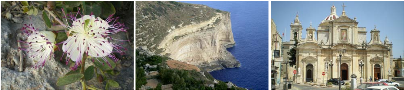
von links nach rechts: Kapernblüten ( Capparis spinosa ), die bis 253 m hohen Dingli Klippen und Kollegiatkirche St. Paul (1664-1668) in Rabat

ordens Teil der Gesamtbefestigung rund um die Hauptstadt. Das Malta at War Museum befasst sich mit Malta im 2. Weltkrieg, ist aber allein schon wegen seiner Unterbringung in einem Teil der Festung aus dem 17. Jahrhundert einen Besuch wert. Im Zentrum der Stadt steht die St.-Lorenz-Kirche aus dem 16. Jh. (mit erneuerter Fassade von 1913), vor der ein Denkmal an den Abzug der Briten 1964 erinnert.