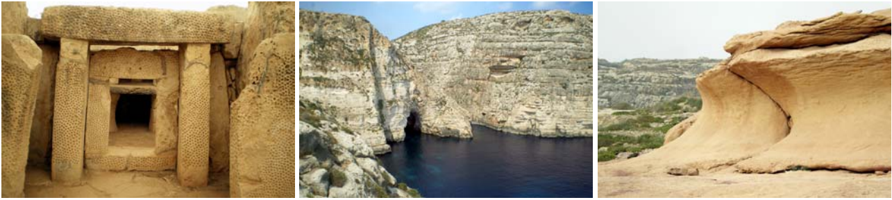
von links nach rechts: rund 5000 Jahre alte Tempel (Mnajdra), Blaue Grotte in der steilen Felsküste, Einblicke in den geologischen Untergrund