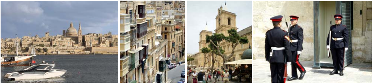
von links nach rechts: die Hauptstadt Valletta, enge Altstadtstraße in Valletta, St. John's Co-Kathedrale und Wachablösung vor dem Präsidentenpalast